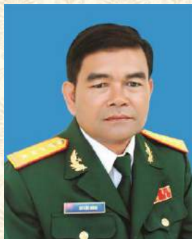
Đại tá Rơ Lữ Bông Chủ tịch Hội CCB tỉnh Đắk Lắk