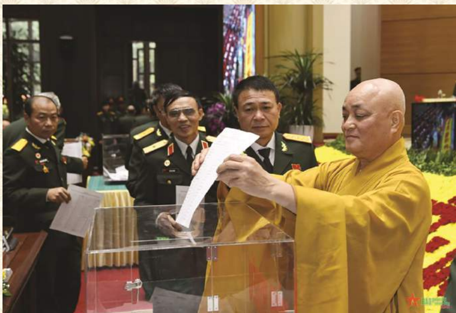
CÁC ĐẠI BIỂU BỎ PHIẾU BẦU BAN CHẤP HÀNH KHOÁ VII