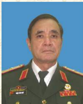
Thiếu tướng Triệu Văn Ngô, Chủ tịch Hội CCB tỉnh Bắc Cạn