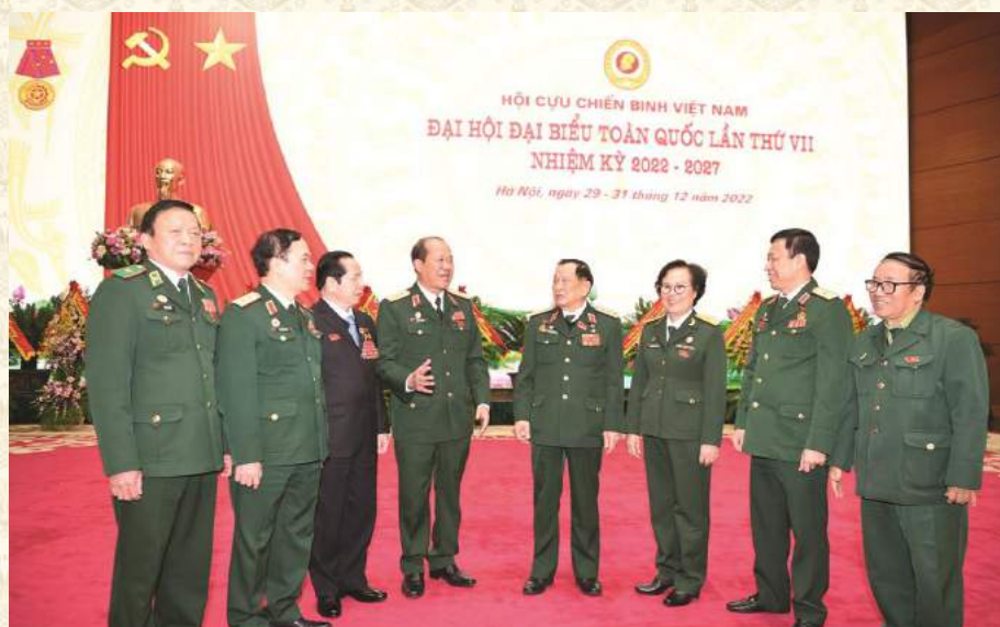
THƯỜNG TRƯC TRUNG ƯƠNG HỘI TRAO ĐỔI VỚI ĐẠI BIỂU TRONG GIỜ GIẢI LAO