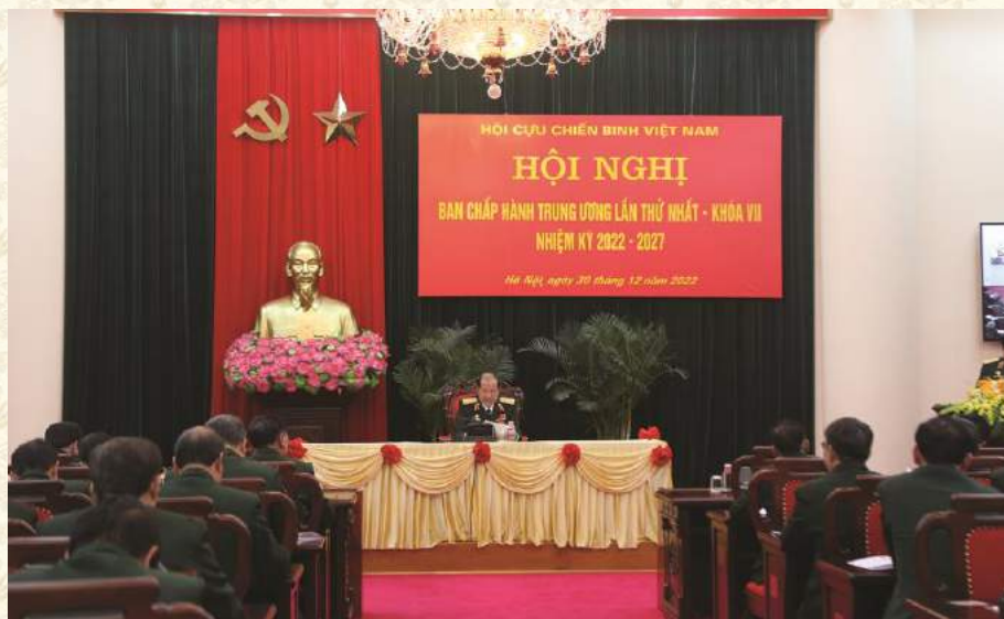
HỘI NGHỊ BAN CHẤP HÀNH TRUNG ƯƠNG HỘI CỰU CHIẾN BINH VIỆT NAM LẦN THỨ NHẤT, KHOÁ VII