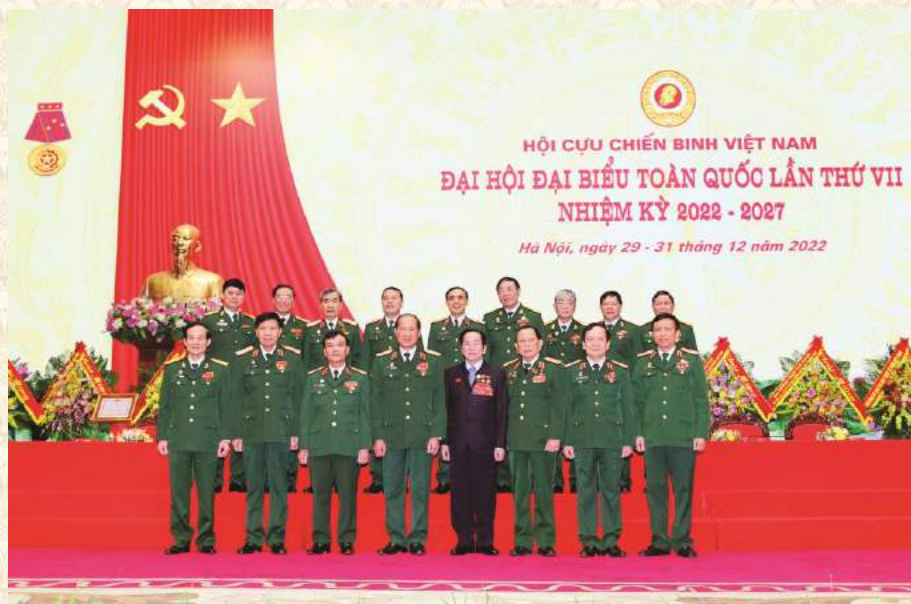
THƯỜNG TRƯC TRUNG ƯƠNG HỘI CHỤP ẢNH LƯU NIỆM VỚI ĐOÀN ĐẠI BIỂU CƠ QUAN TRUNG ƯƠNG HỘI CỰU CHIẾN BINH VIỆT NAM