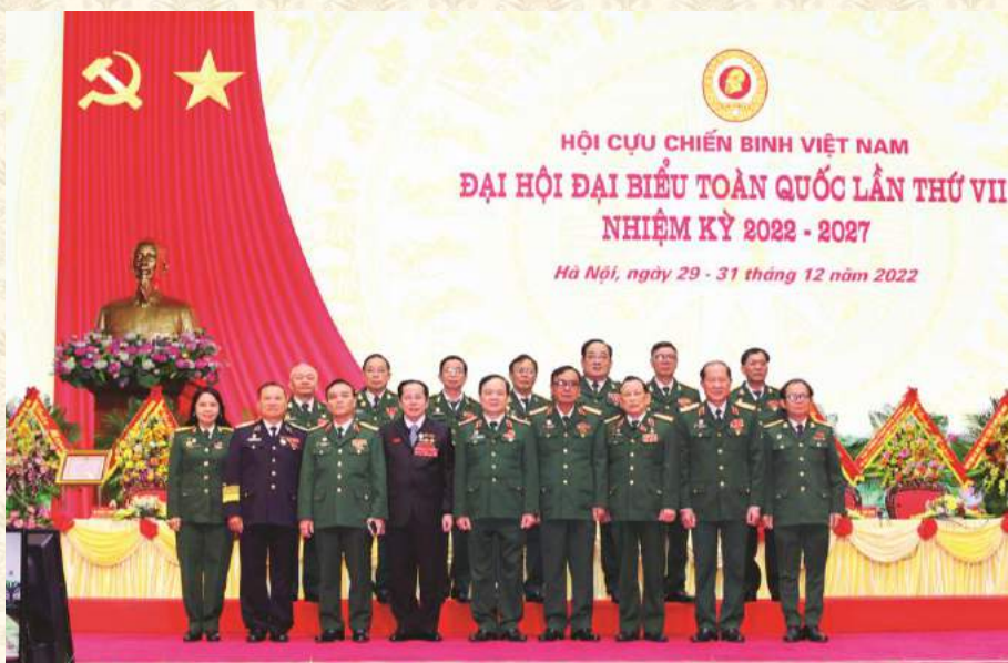
THƯỜNG TRƯC TRUNG ƯƠNG HỘI CHỤP ẢNH LƯU NIỆM VỚI ĐOÀN ĐẠI BIỂU HỘI CỰU CHIẾN BINH THÀNH PHỐ HỒ CHÍ MINH