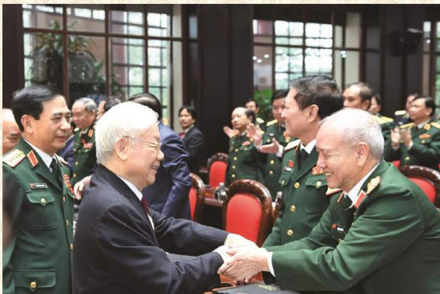
TỔNG BÍ THƯ NGUYỄN PHÚ TRỌNG BẮT TAY CÁC ĐẠI BIỂU DỰ ĐẠI HỘI