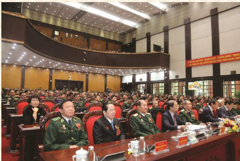
CÁC ĐẠI BIỂU DỰ ĐẠI HỘI