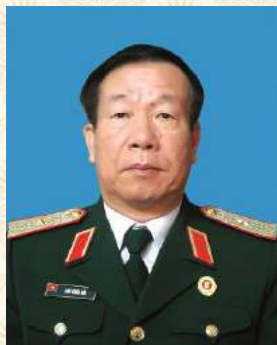
Thiếu tướng Lưu Xuân Cải, Chủ tịch Hội CCB thành phố Hải Phòng