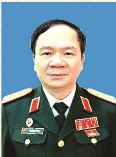
Trung tướng Khuất Việt Dũng, Phó Chủ tịch Hội CCB Việt Nam Đại biểu Quốc hội XV