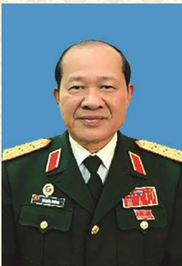
Thượng tướng Bế Xuân Trường, Chủ tịch Hội CCB Việt Nam