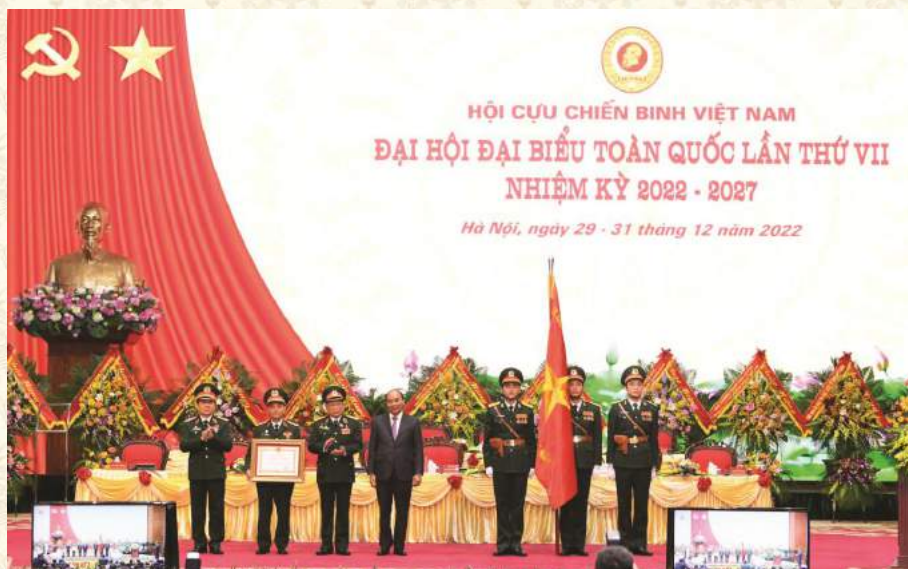
CHỦ TỊCH NƯỚC NGUYỄN XUÂN PHÚC TRAO TẶNG HUÂN CHƯƠNG LAO ĐỘNG HẠNG NHẤT CHO HỘI CỰU CHIẾN BINH VIỆT NAM