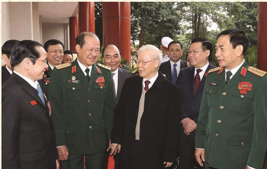
TỔNG BÍ THƯ NGUYỄN PHÚ TRỌNG TRAO ĐỔI VỚI LÃNH ĐẠO ĐẢNG, NHÀ NƯỚC VÀ TRUNG ƯƠNG HỘI