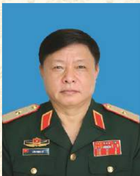
Thiếu tướng Lưu Trọng Lưu, Chủ tịch Hội CCB tỉnh Điện Biên