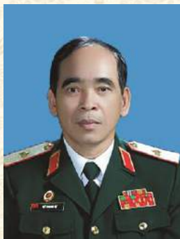
Thiếu tướng Hồ Thanh Tự, Chủ tịch Hội CCB tỉnh Quảng Trị