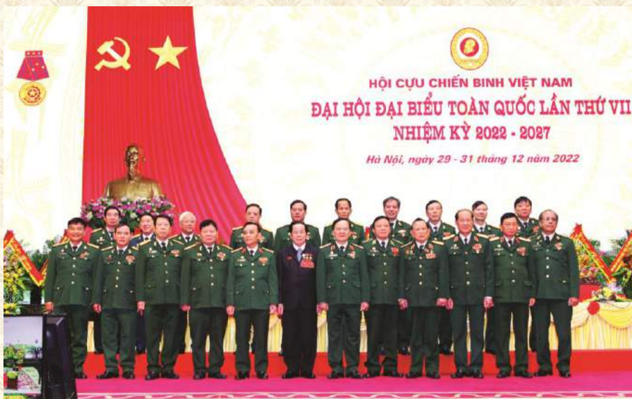
THƯỜNG TRƯC TRUNG ƯƠNG HỘI CHỤP ẢNH LƯU NIỆM VỚI ĐOÀN ĐẠI BIỂU HỘI CỰU CHIẾN BINH THÀNH PHỐ HÀ NỘI