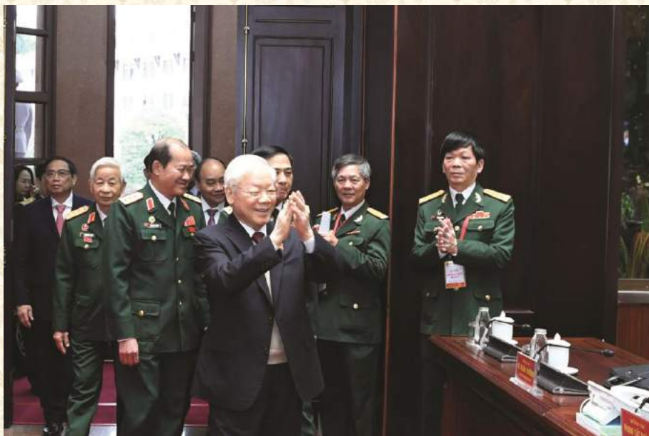
TỔNG BÍ THƯ NGUYỄN PHÚ TRỌNG CHÀO CÁC ĐẠI BIỂU DỰ ĐẠI HỘI