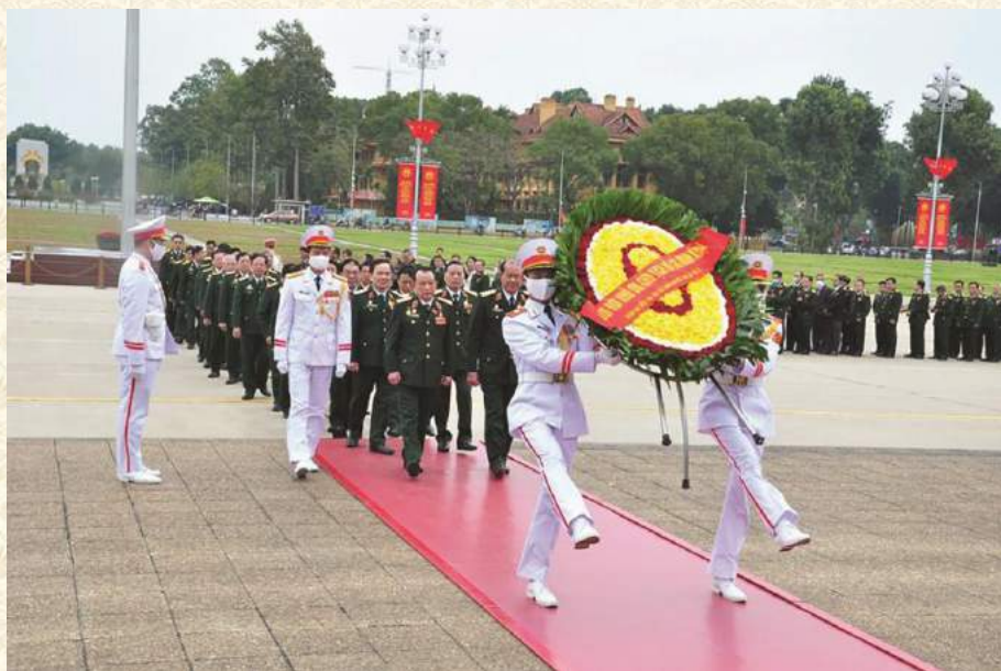
CÁC ĐẠI BIỂU VÀO LĂNG VIẾNG CHỦ TỊCH HỒ CHÍ MINH