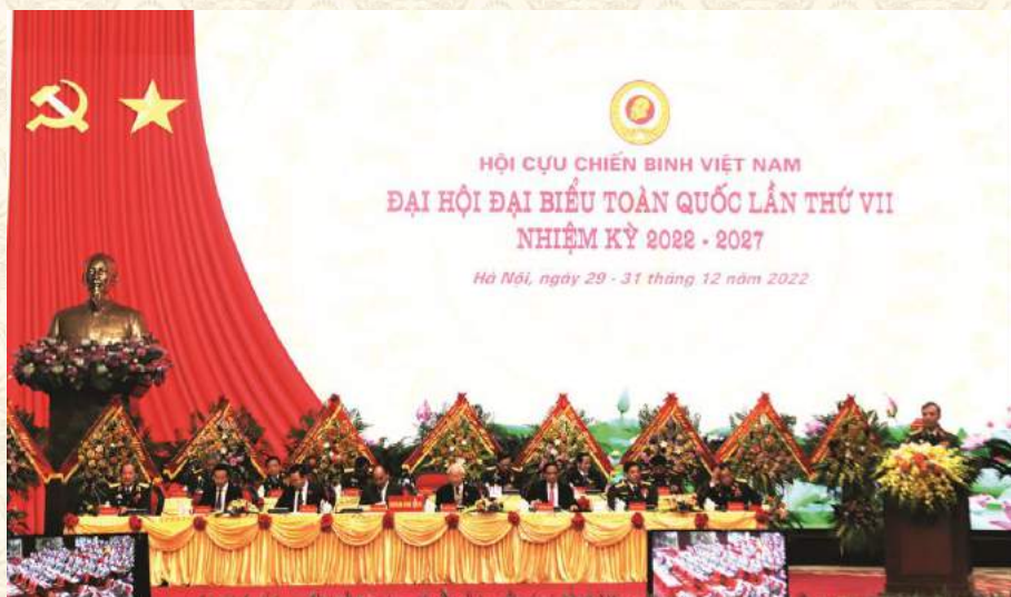
LÃNH ĐẠO ĐẢNG, NHÀ NƯỚC, QUÂN ỦY TRUNG ƯƠNG THAM GIA ĐOÀN CHỦ TỊCH ĐẠI HỘI