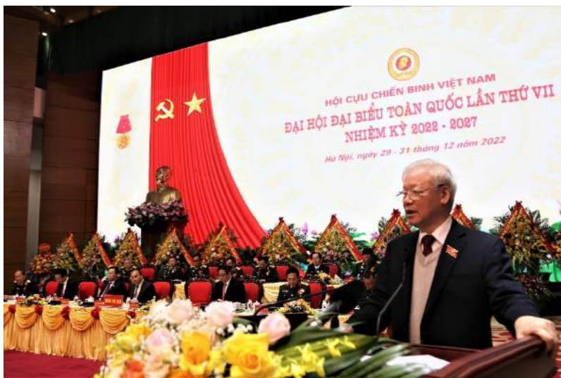
Tổng Bí thư Nguyễn Phú Trọng phát biểu chỉ đạo tại Đại hội

(Phát biểu của đồng chí Nguyễn Phú Trọng, Tổng Bí thư Ban Chấp hành Trung ương Đảng Cộng sản Việt Nam tại Đại hội đại biểu toàn quốc Hội Cựu chiến binh Việt Nam lần thứ VII, sáng ngày 30 tháng 12 năm 2022)