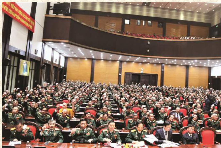
CÁC ĐẠI BIỂU BIỂU QUYẾT THÔNG QUA DANH SÁCH BAN CHẤP HÀNH KHOÁ VII