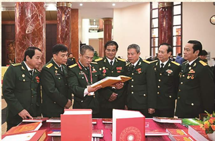
CÁC ĐẠI BIỂU THAM QUAN KHU TRƯNG BÀY CÔNG TRÌNH CHÀO MỪNG ĐẠI HỘI